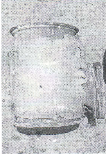
Ancienne isolation abîmée