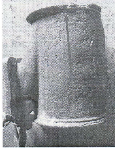
Partie concernée par l'isolation Longueur : 240mm environ Diamètre : 165mm environ