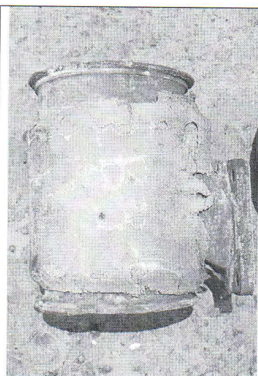
Ancienne isolation abîmée